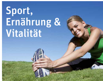
Sport, Ernährung & Vitalität