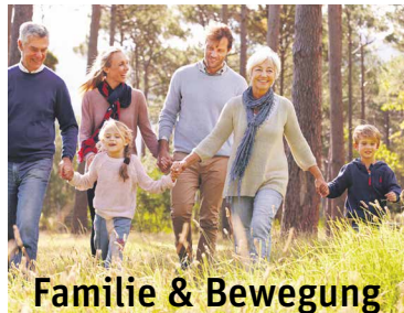
Familie & Bewegung